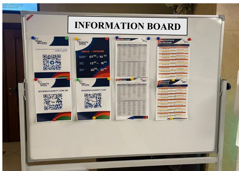
График трансферов в пункты отъезда будет размещен на информационных стойках в официальных отелях за сутки до Вашего выезда. Пожалуйста, обратитесь на информационную стойку в Вашем отеле для корректировки данных, если таковые указаны не верно.

Просим Вас указывать данные о датах, времени и рейсе Вашего прибытия и отъезда при регистрации. ВАЖНО! Организаторы Форума не могут гарантировать качественное оказание сервиса по трансферам от/до пунктов прибытия/отъезда в случае незаполнения таких данных на сайте электронной регистрации.